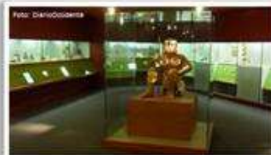
Visita al Museo del Oro Calima