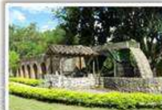
Almuerzo en Museo de la Caña