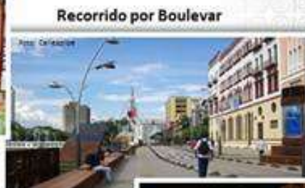
Recorrido por Boulevard