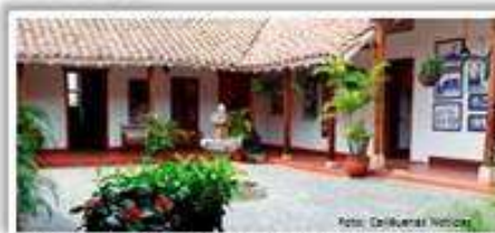
Almuerzo en Sociedad de Mejoras Públicas