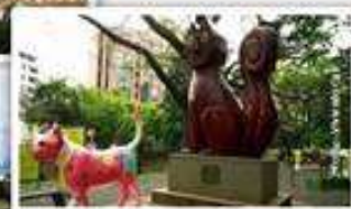
Visita a Hacienda El Paraiso

Centro Cultural de CALI 13, 14 y 15 de noviembre de 2019