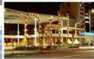
City tour panorámico